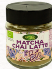
MATCHA CHAI LATTE 60g

Ingredientes: Té Matcha (45%), Canela, Jengibre, Anís Verde, Nuez Moscada, Cardamomo, Pimienta Negra.