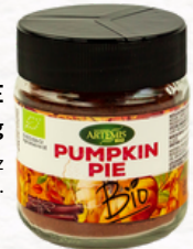
PUMPKIN PIE 60g

Ingredientes: Canela (52%), nuez moscada, jengibre, clavo y cardamomo.