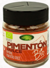
PIMENTÓN DULCE 75g