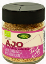
AJO GRANULADO 100g