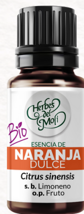
NARANJA DULCE 10 c.c.