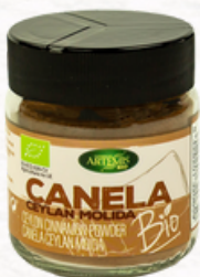
CANELA CEYLAN MOLIDA 70g