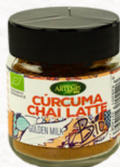
CÚRCUMA CHAI LATTE 60g

Ingredientes: Cúrcuma(45%), Canela, Jengibre, Anís Verde, Nuez Moscada, Cardamomo, Pimienta Negra.