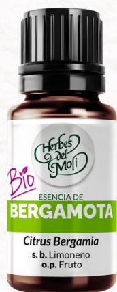
BERGAMOTA 10 c.c.