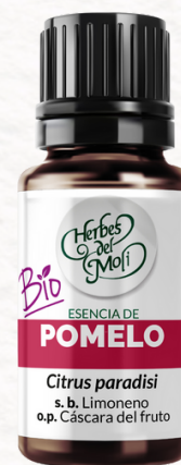
POMELO 10 c.c.

Todos los productos proceden de la agricultura ecológica