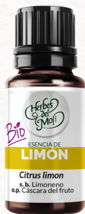
LIMÓN 10 c.c.