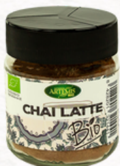
CHAI LATTE 60g Ingredientes: Canela, Jengibre, Anís Verde, Nuez Moscada, Cardamomo, Pimienta Negra.

Ingredientes: Cúrcuma(45%), Canela, Jengibre, Anís Verde, Nuez Moscada, Cardamomo, Pimienta Negra.