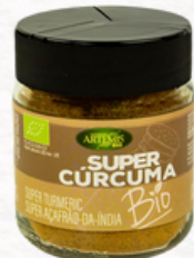
SUPER CÚRCUMA 80g

Ingredientes: Canela (52%), nuez moscada, jengibre, clavo y cardamomo.