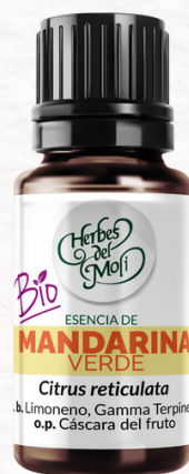
MANDARINA VERDE 10 c.c.