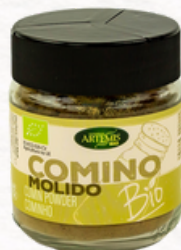
COMINO MOLIDO 75g