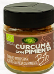
CÚRCUMA CON PIMIENTA 80g